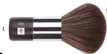
1 PĘDZEL KABUKI NR 400