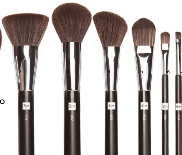
3 PĘDZEL DO PUDRU NR 402