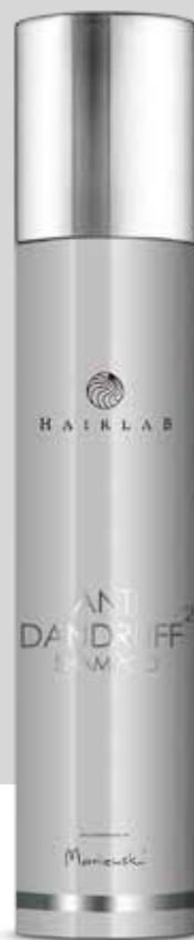
ANTI DANDRUFF² SHAMPOO | 250 ml