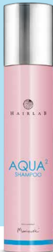
AQUA² SHAMPOO | 250 ml