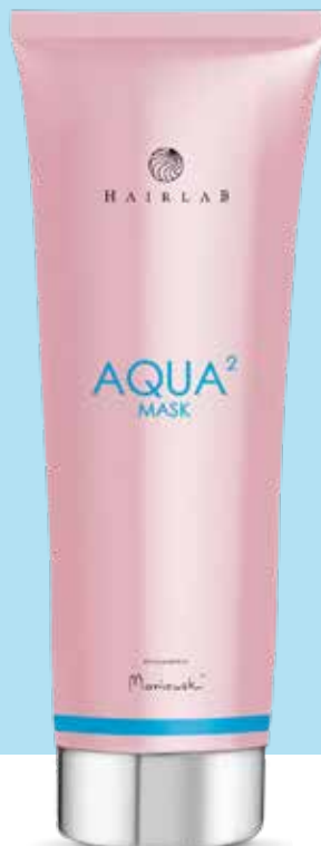
AQUA² MASK | 250 ml