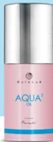
AQUA² OIL | 100 ml