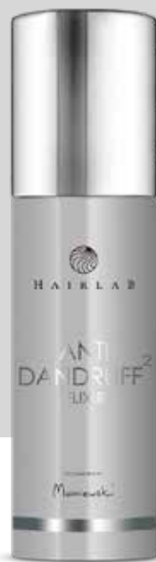
ANTI DANDRUFF² ELIXIR | 150 ml